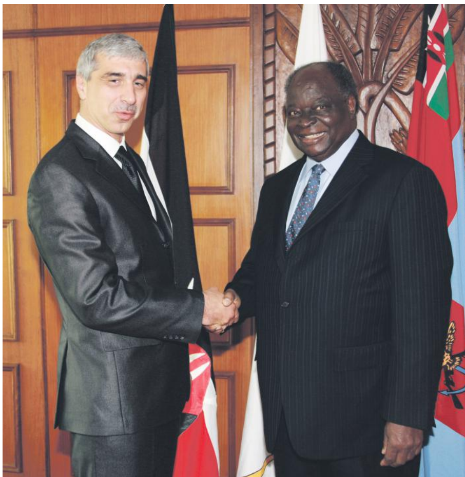
Снимка с предишния президент на Кения Кобаки

Yes, I mentioned her not only because she was my mother but also because she was an outstanding professional who worked almost to the end of her life; a person of exceptional and extensive experience, a person with a legal career that spanned nearly 50 years. Formally she was the reason for the establishment of Law Firm S&D. I was lucky my mother was appointed the Secretary of the 8th Bar Team; this is how we used to work at the time, in “teams”, there were 9 in total. Remuneration was subject to a