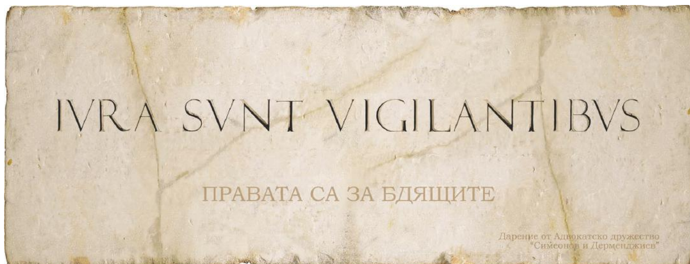
Дарение от S&D за Софийски районен съд